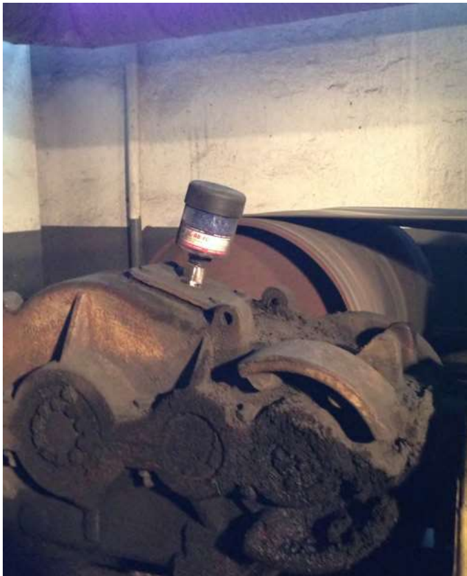
Transmisija, anglies sektorius